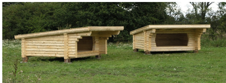
Shelters på 2,5 x 3,0 meter indvendig gulvmål. Vælg mellem ret tag som foto eller saddeltag.

"Flagskibet" og den mest populære model i serien af sheltere, er fuldtømmer shelteren, bygget af stammer skåret på tre sider og med den naturlige runding udad.