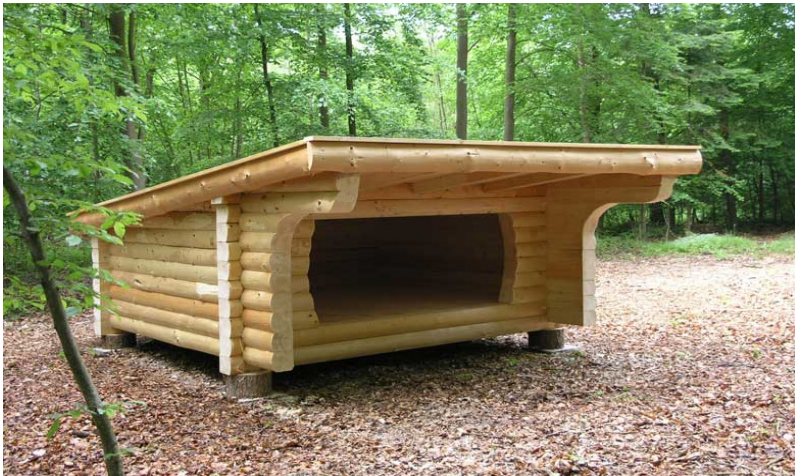
Shelter på 2,5 x 3,0 meter indvendig gulvmål, Rødby, Lolland